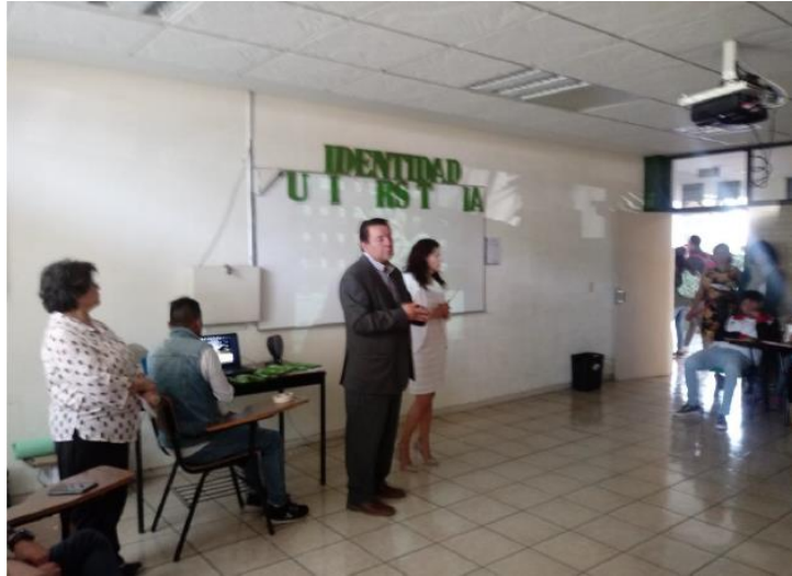
Figura 4: Lic. en Informática Administrativa, 4° semestre, turno matutino.

De forma personal considero que cada estudiante utilizó su creatividad, haciendo uso de información en donde destacaron las características más importantes.