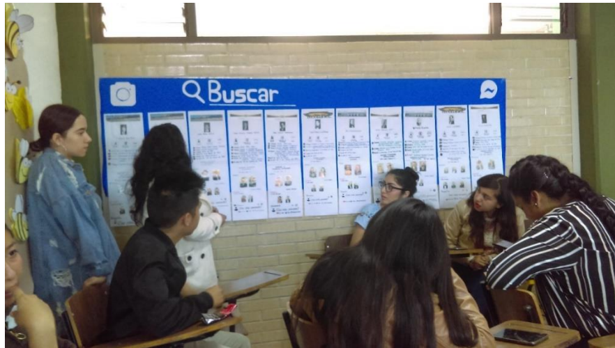
Figura 13: Personajes importantes de la UAEM. Licenciatura en Contaduría, 4° semestre, turno matutino.

En la Figura 13, se puede apreciar la exposición sobre el tema de personajes importantes en la UAEM, en donde los estudiantes utilizan un formato en línea para buscar los aspectos más relevantes aportados por cada uno.